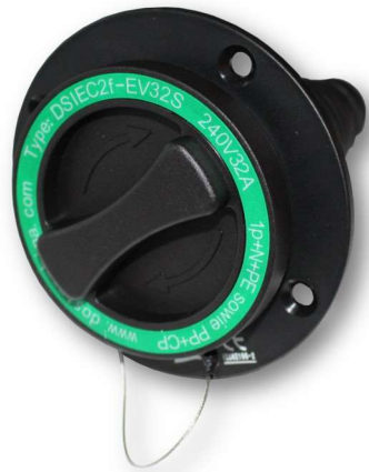
Typ 2 Ladedose, 16A, männlich